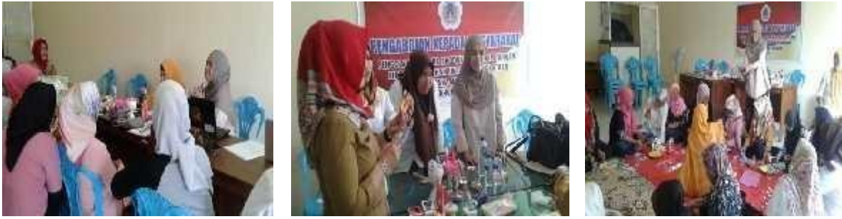
Gambar 2. Pemberian Materi Pelatihan Aspek Marketing Mix