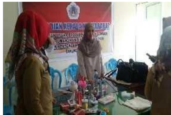
Gambar 3 .Proses pembuatan kerajinan tangan ibu-ibu rumah tangga.