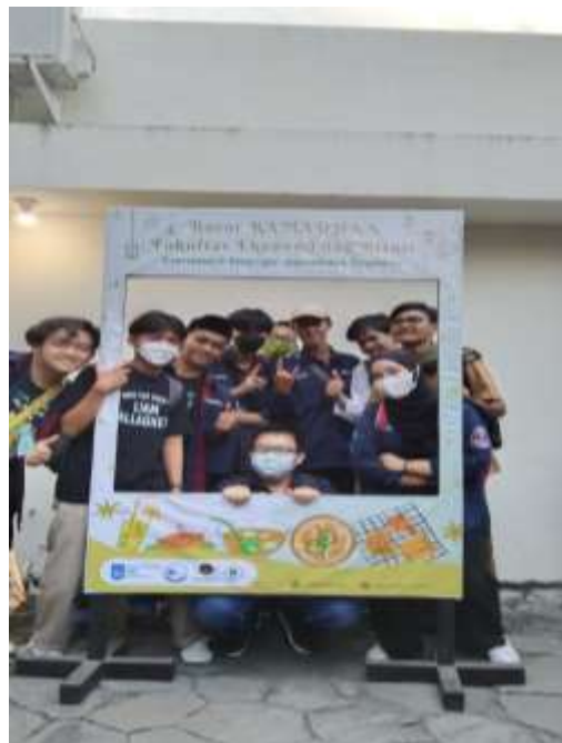
Gambar 3: Kegiatan Buka Bersama Mahasiswa UCIC.

Kegiatan ini dilakukan pada hari Sabtu, 17 April 2023. Kegiatan ini bertemakan UCARE KAREEM 2023 "Bergerak Bersama, Bersikap Peduli" yang dihadiri oleh seluruh mahasiswa/i UCIC dan juga dihadiri oleh anak-anak panti asuhan. Acara ini juga mengadakan berbagai lomba yang diikuti oleh seluruh mahasiswa/i semester 2. Adapun bazaar yang diadakan oleh BKM dan diramaikan oleh anggota HIMA.