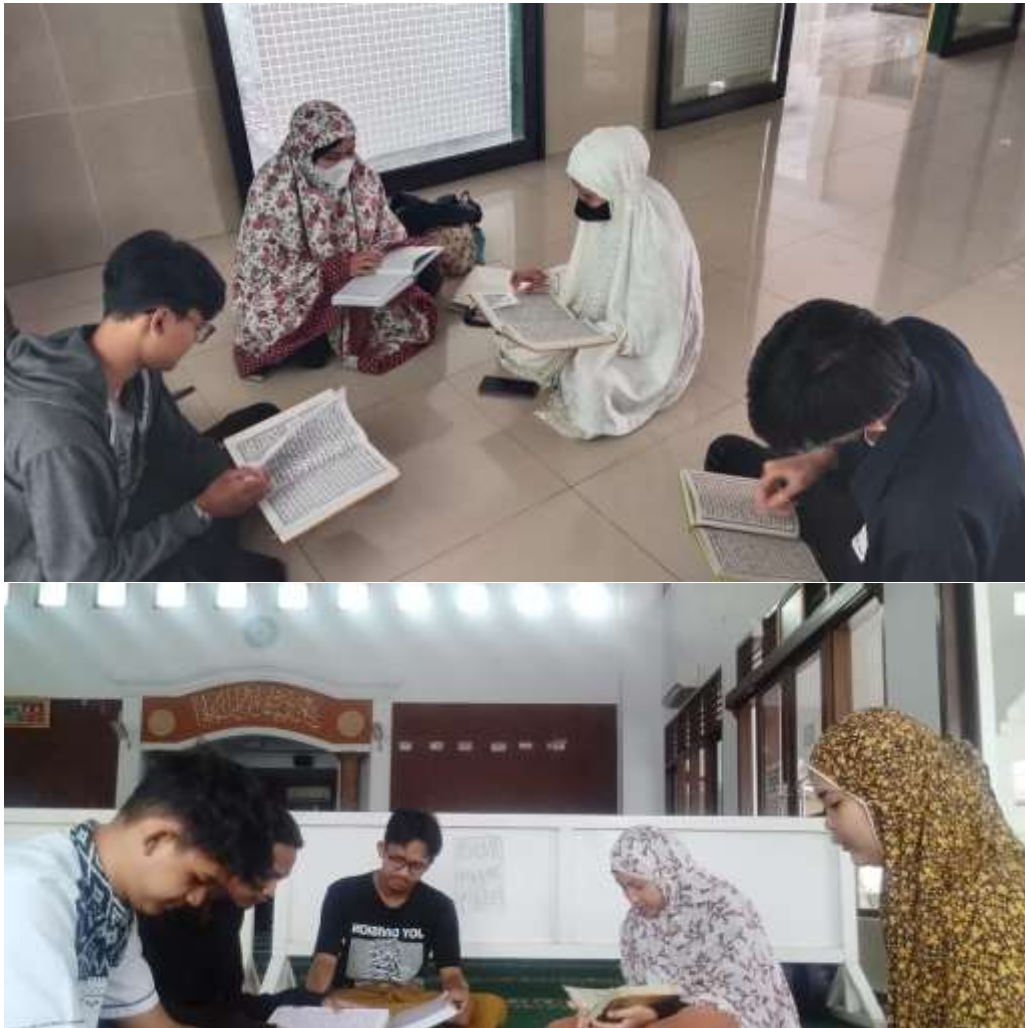
Gambar 1: Kegiatan Tarawih Mahasiswa Prodi Manajemen Informatika.

Metode-metode yang digunakan dalam penyelesaian pelaksanaan pengabdian kepada masyarakat dituliskan di bagian ini. Bagian ini memuat khalayak sasaran, lokasi kegiatan, metode yang digunakan, evaluasi kegiatan, materi kegiatan. Bagian ini juga berisi informasi yang lengkap bagi pembaca bila ingin melakukan hal yang sama. Bahan yang digunakan harus dijelaskan asalnya dan kuantitasnya. Cara kerja dan analisa data harus ditulis secara jelas dan ringkas. Modifikasi dan cara kerja yang pernah dipublikasikan cukup menyebut sumbernya dan menjelaskan bagian yang dimodifikasi. Bila menggunakan uji statistik, cukup ditulis metodanya misalnya RCBD atau Faktorial. Bagian ini, dapat digunakan satu jenis metode ataupun kombinasi beberapa jenis metode. Beberapa contoh metode sebagai berikut.