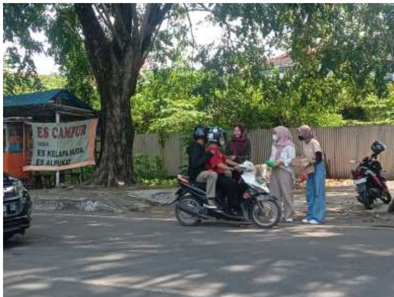
Gambar2 : Berbagi takjil di Bulan Ramadhan.

Kegiatan ini dilakukan pada hari Kamis, 15 April 2023. Kegiatan ini dilakukan oleh mahasiswa/i yang bertujuan untuk meningkatkan kesejahteraan antara mahasiswa dan masyarakat sekitar. Kegiatan ini menargetkan orang-orang yang sedang berlalu-lalang di jalan Kesambi depan Kampus UCIC. Mulai dari mahasiswa hingga khalayak umum yang berhak mendapatkan takjil. Kegiatan ini mendapatkan modal dari hasil pengumpulan dana setiap mahasiswa/i. Kami berharap bulan Ramadhan selanjutnya kegiatan ini akan selalu menjadi rutinitas mahasiswa UCIC kedepannya saat Bulan Ramadhan.