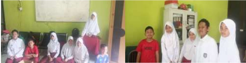
Gambar 3. Penjelasan Kegiatan Pembuatan Materi dan Persentasi Canva

mengajarkan membuat materi yang nantinya akan dimasukkan ke dalam persentasi, diambil keputusan tema yang akan dibuat yaitu Menenal Magnet. Kemudian dilanjutkan dengan membuat presentasi menggunakan canva, setelah itu langsung percobaan praktek persentasi menggunakan canva.