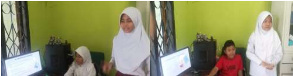
Gambar 4. Praktek Pembuatan dan Persentasi Canva