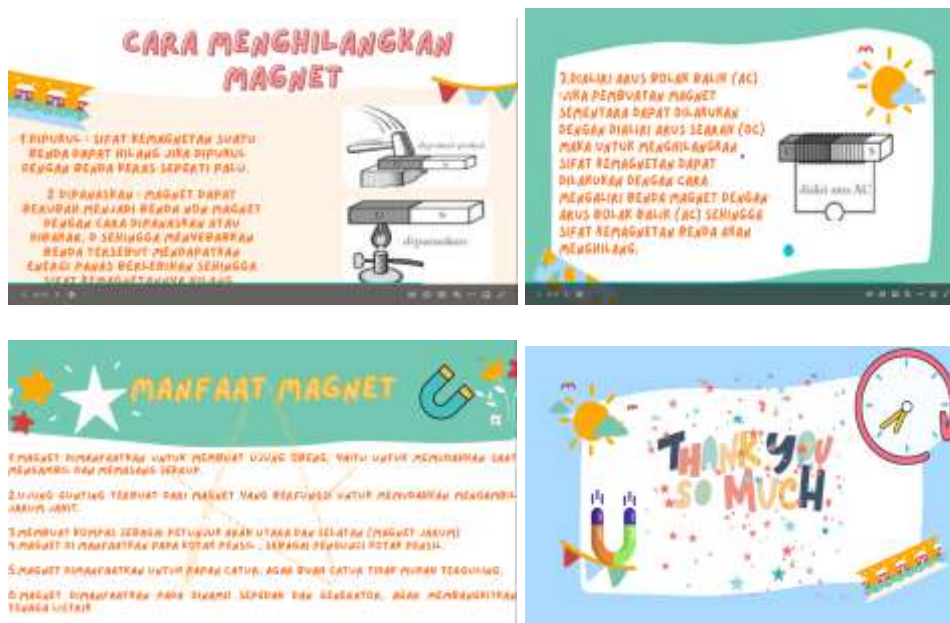
Gambar 2 . Jenis Kegiatan Persentasi Menggunakan Canva